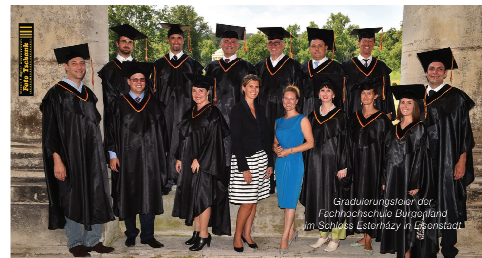
Graduierungsfeier der Fachhochschule Burgenland im Schloss Esterházy in Eisenstadt

Da Prozesse keine betriebsübergreifenden oder auch innerbetrieblichen Grenzen kennen, wird im Studium besonderer Wert auf die Vermittlung einer breiten Wissensbasis gelegt. Die vermittelten Grundlagen, Ansätze, Konzepte, Methoden und Werkzeuge im Prozessmanagement sind für Dienstleistungs-, Industrie- und Produktionsunternehmen ebenso relevant wie in sozialen Einrichtungen und der öffentlichen Verwaltung.