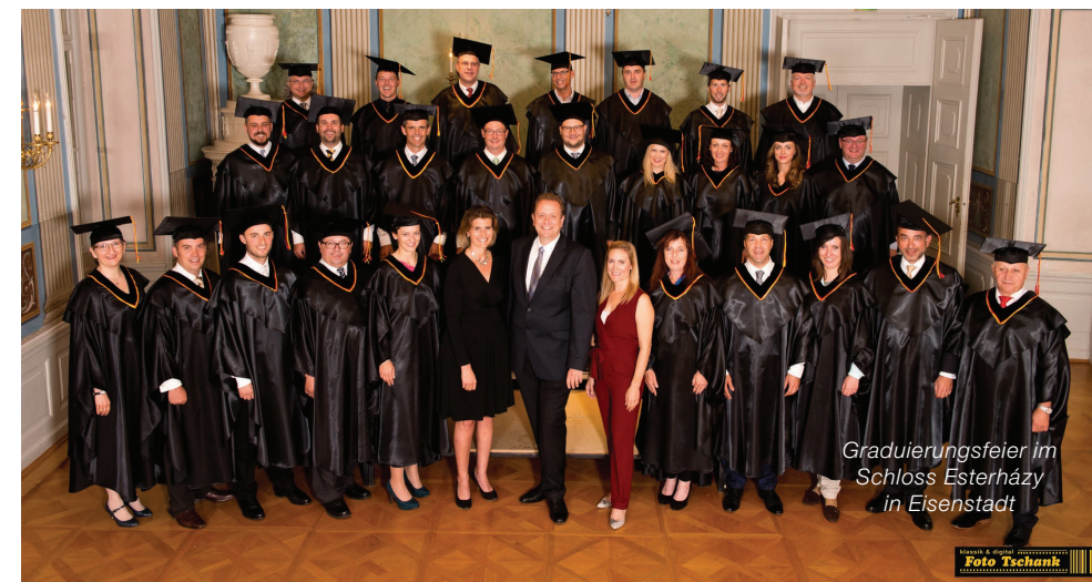
Graduierungsfeier im Schloss Esterházy in Eisenstadt

Der Erfolg dieses e-learning-Formats beruht einerseits auf dem hervorragenden Wissenstransfer und andererseits auf dem Praxistransfer – erst die Anwendung von Wissen ermöglicht das Verständnis von Zusammenhängen und sichert die Nachhaltigkeit. Die Lehrgänge finden in kompakten Modulen statt. Sie bereiten sich auf einer interaktiven Online-Plattform auf den Leistungsnachweis vor, vertiefen Ihr Wissen während der Abarbeitung von praxisorientierten Case Studies und festigen die neu erworbenen Kenntnisse in der Nachbereitungsphase, indem Sie das Erlernte an weitere Praxis-Cases anwenden.